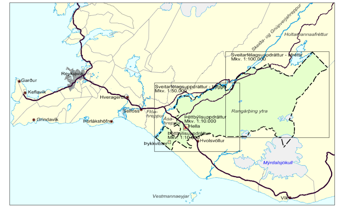
Afstöðumynd í mkv, 1:1.500.000.