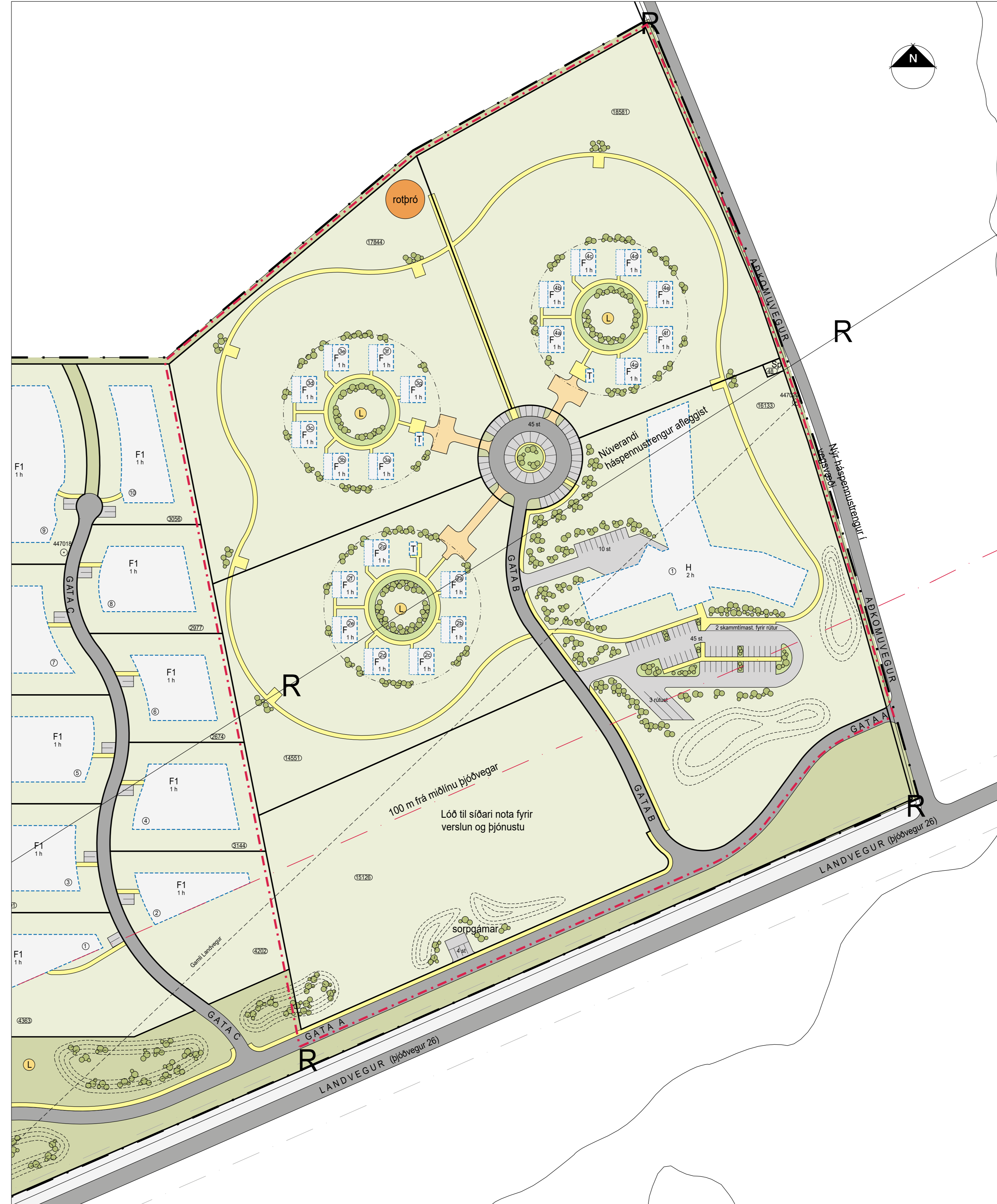
Deiliskipulagsbreyting nær til austurhluta skipulagsvæðis. 1:1000/ A-0