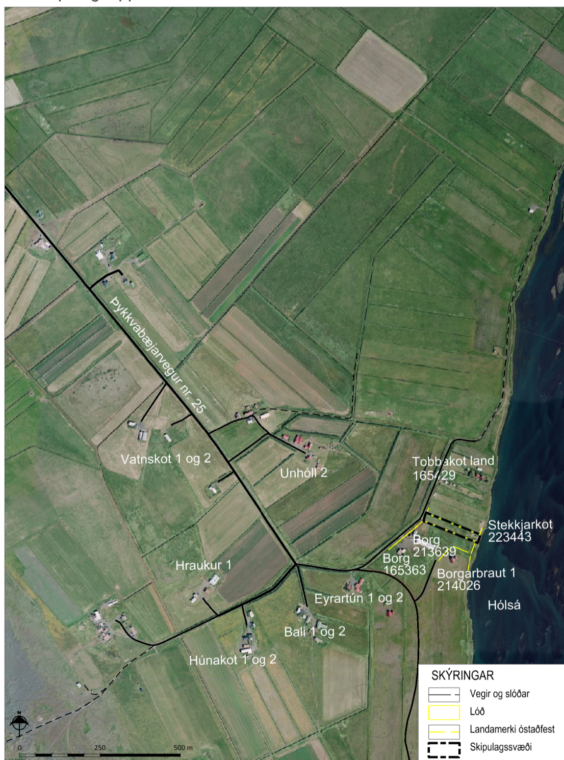
Skýringaruppráttur í mkv. 1:12.000

Deiliskipulagstillagan var kynnt dags. _____