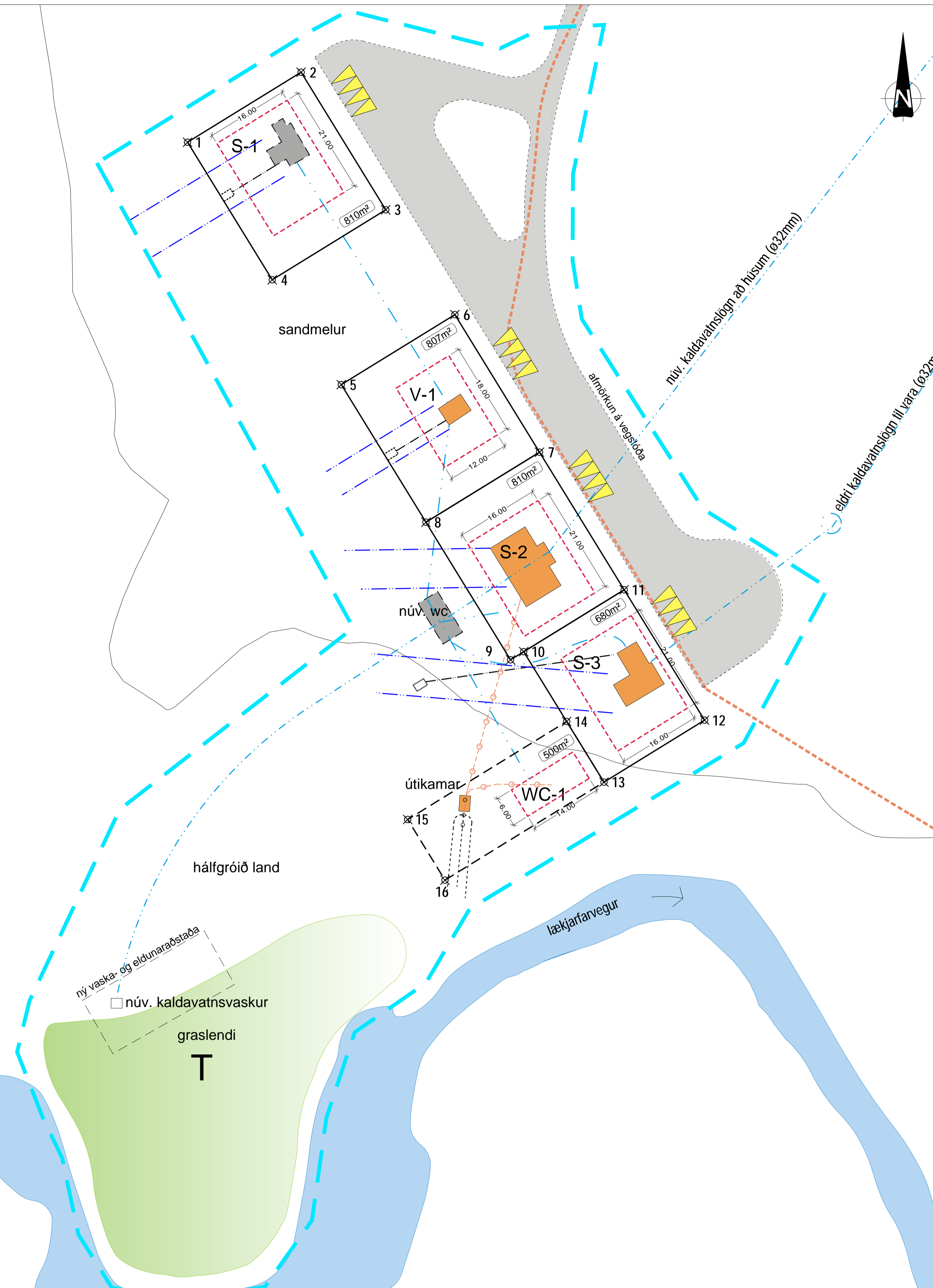
Deiliskipulagsuppráttur í mkv.1:500