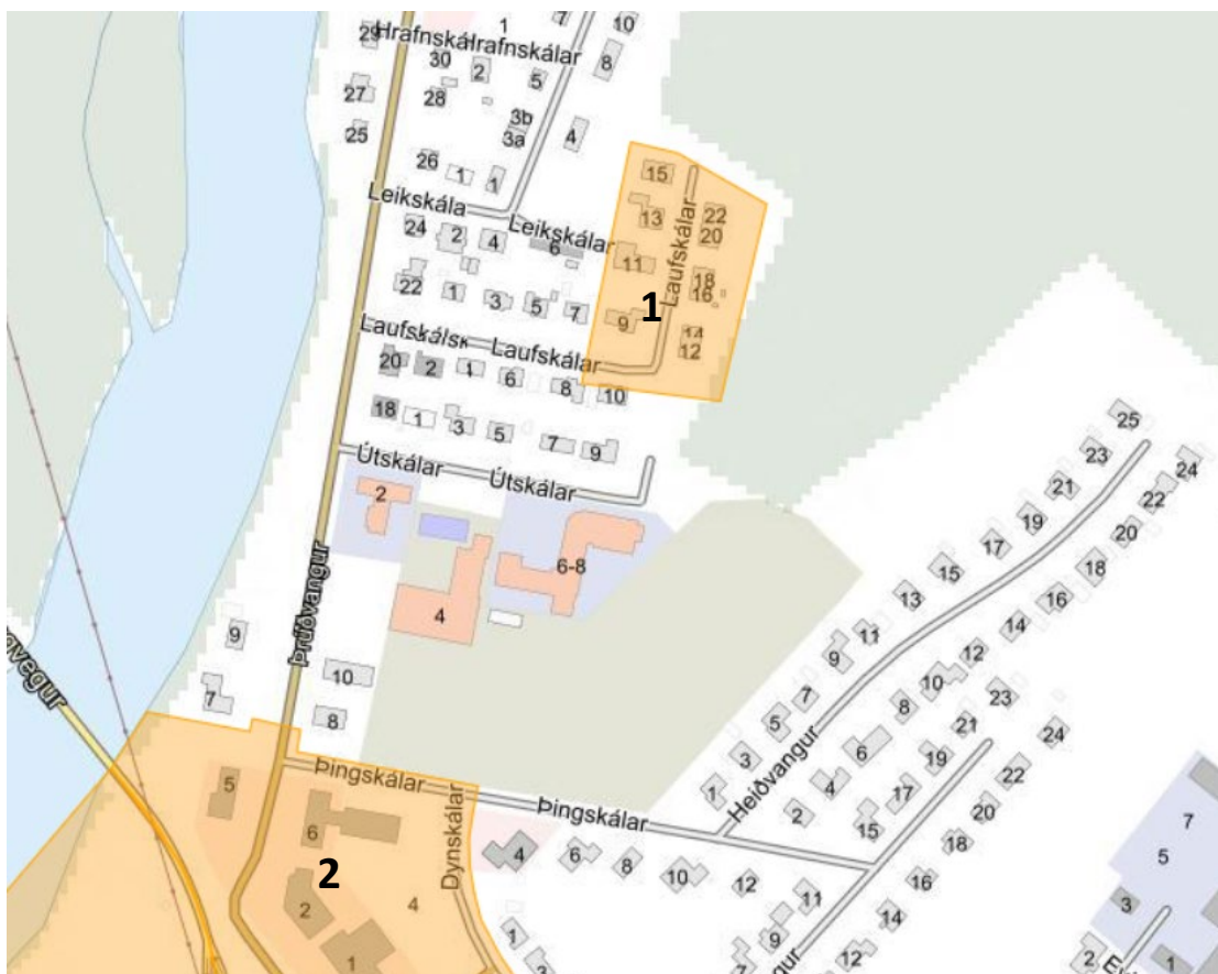
Mynd 4 Deiliskipulagssvæði við fyrirhugað deiliskipulagssvæði