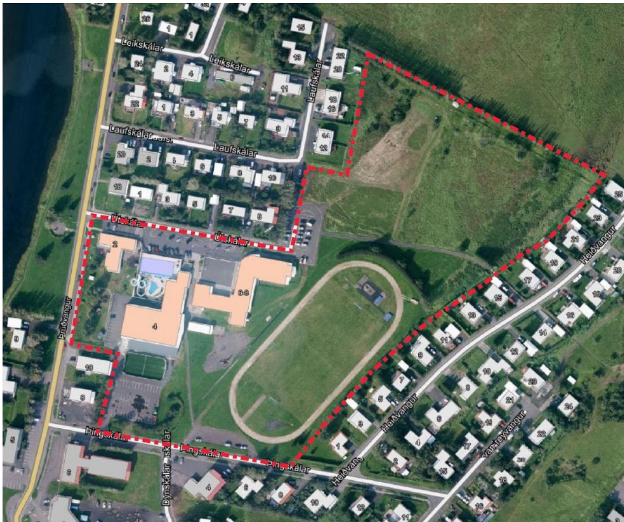
Mynd 1 Staðsetning fyrirhugaðs skipulagssvæðis afmarkað gróflega með rauðri brotalínu

Á mynd x má sjá afmörkun fyrirhugaðs skipulagssvæðis.