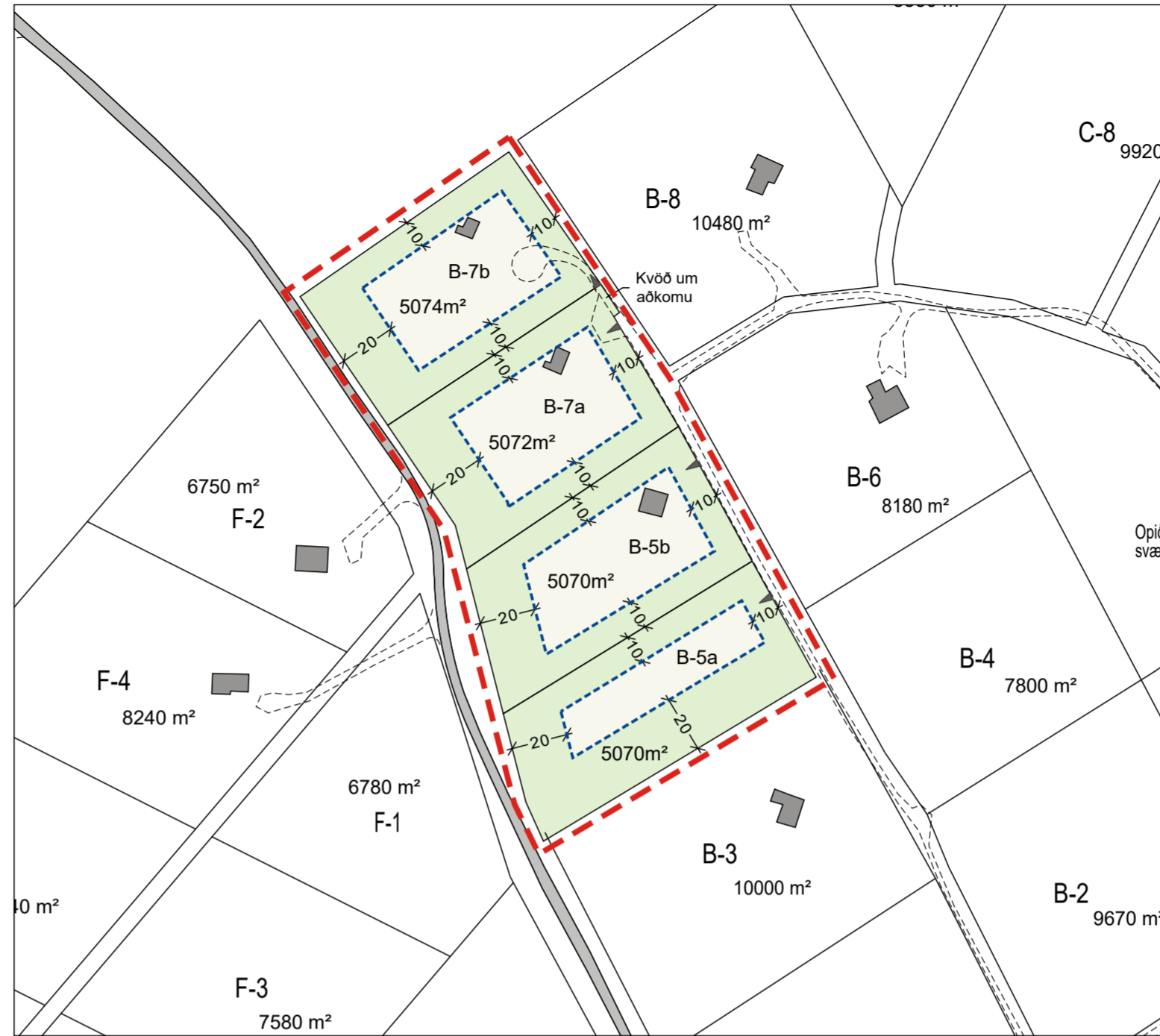
Tillaga að breytingu á skipulagi, sýnt á staðfærðum lóðargrunni. Mkv. 1:2000