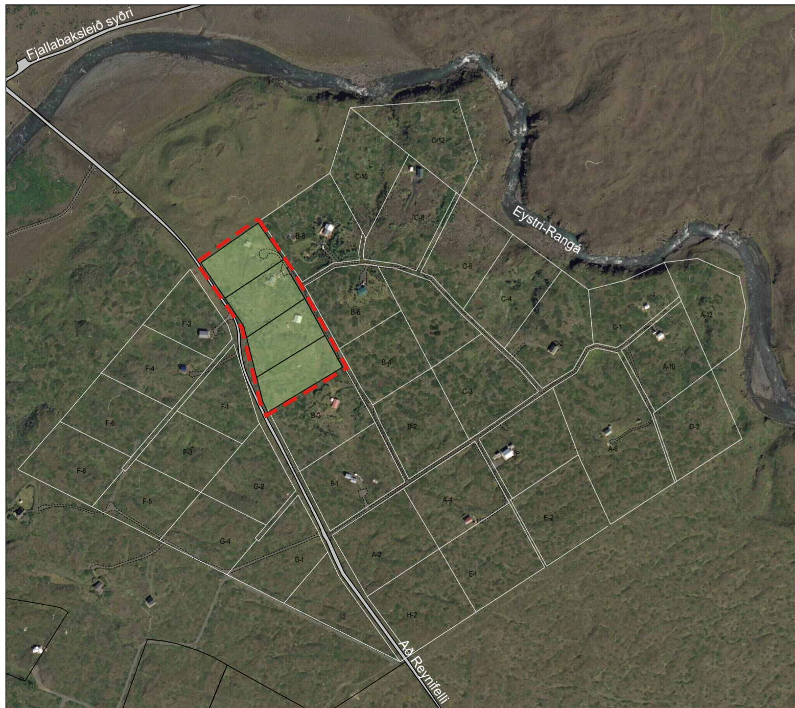
Yfirlitsmynd, lóðargrunnur af skipulagssvæðinu skv. mælingu og teikningu Mannvits, dags. 11.12.2009 Lóðir B-5 og B-7 teiknaðar upp skv. mælingu / upprætti gerða af Landnot ehf. 13.10.2020. Mkv. 1:2000