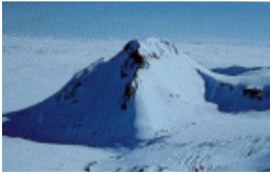
Arnarfell hið mikla