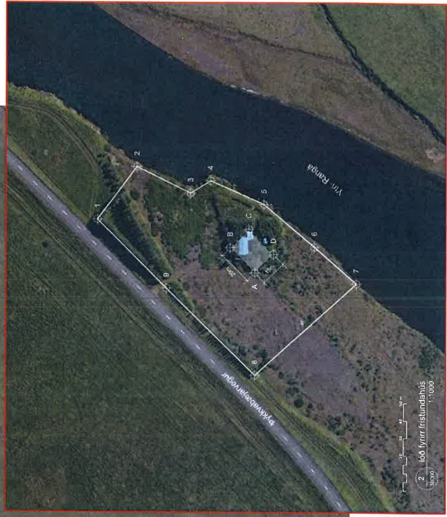
2 lóð fyrir fristundahús 1:1000